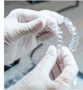
Aligneur Biotech Dental. Un traitement pour un patient nécessite en moyenne 35 gouttières et coûte entre 3500 et 5000 euros.

premières années, avant que la concurrence ne provoque un tassement de ses ventes. Elle vient d'être rachetée par Dr Clear Aligners, basé à Singapour. « La concentration du secteur sera un passage obligé », selon son PDG. Lancée en France fin 2020, la start-up allemande Dr Smile a, quant à elle, été avalée par le géant suisse Straumann.